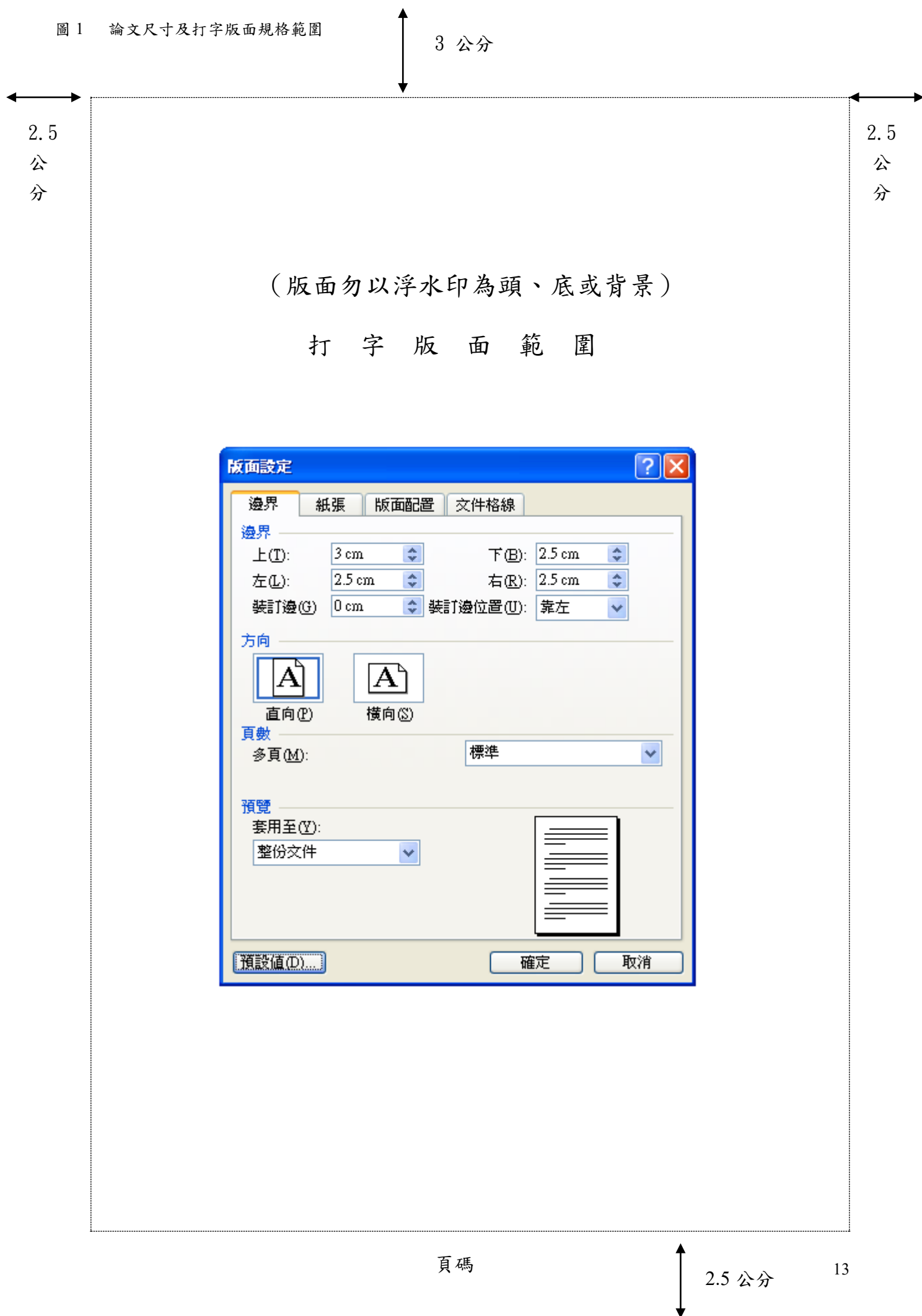
圖 1 論文尺寸及打字版面規格範圍